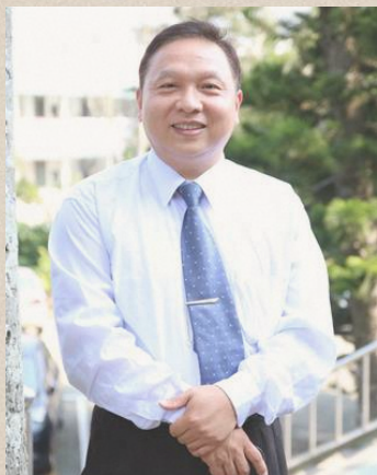
大智分營區營主任 國立臺東高級商業職業學校