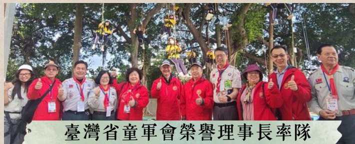
臺灣省童軍會榮譽理事長率隊 到營區鼓勵童軍大露營伙伴們