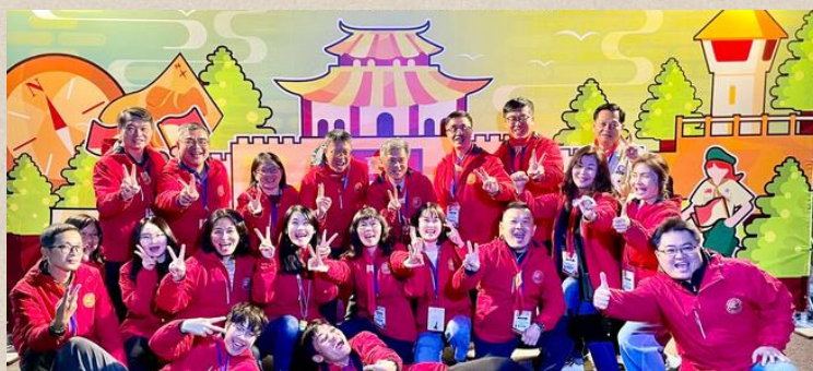
國教署彭富源署長肯定曾文家商團隊的用心