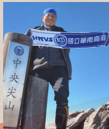
大勇分營區營主任 國立華南高級商業職業學校

最後，再次感謝每位前來參加的童軍夥伴和工作團隊，也希望大家在接下來的活動中，享受每一刻，收穫友誼與成長，共同創造美好的回憶！