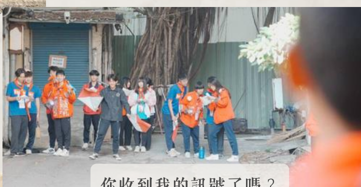
你收到我的訊號了嗎？