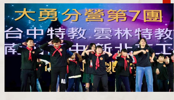
由彭署長見證曾家與東商共同傳遞童軍精神